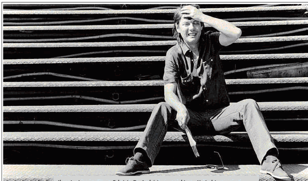
Il cantautore genovese Fabrizio De André in un vecchio scatto in bianco e nero