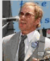
WARREN ZEVON Ucciso da un tumore nel 2003, non è mai stato amato dai discografici per l'impegno civile. Da non perdere "Warren Zevon"