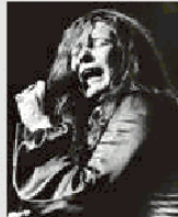
JANIS JOPLIN Per la blues singer texana, morta nel 1970, l'industria del disco non ha fatto nulla. Eppure "Kozmic Blues" è un album magistrale