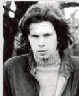
NICK DRAKE Nessuna considerazione per il cantautore ucciso dagli antidepressivi nel 1974. Ma il suo "Pink Moon" è un disco imperdibile